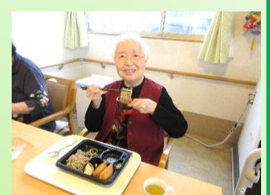
この日のランチはデリバリー！ ハンバーガーや牛丼、お蕎麦など、好きな物を選んで食べました♡