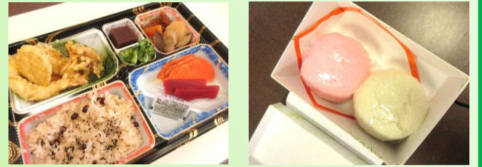
紅白まんじゅうに特製ランチ！ たくさん食べてお腹いっぱいでした☆